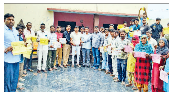
वाल्मीकि भवन एवं खलरावास निर्माण भूमि पूजन कार्यक्रम को लेकर निमंत्रण पत्र देते हुए।