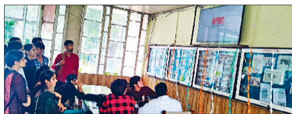
जीद। कार्यक्रम में भाग लेते विद्यार्थी।