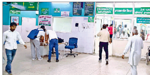
जीद। नागरिक अस्पताल का इमरजेंसी वार्ड।

जिला मुख्यालय स्थित नागरिक अस्पताल पर से रेफरल का ठप्पा हटाने के लिए धीरे-धीरे स्वास्थ्य सुविधाओं को मजबूत किया जा रहा है। रात के समय आने वाले रोजों तथा रोड साइड एम्बुलेंसों के दौरान लोगों की शिकायतें रहती हैं कि उन्हें बेहतर उपचार नहीं मिलता और रोहतक रेफर कर दिया जाता है।