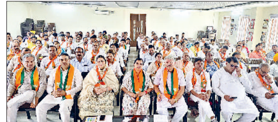
कैथल। भाजपा कार्यालय में कार्यशाला में उपस्थित अधिकारी।

आज कैथल स्थित भाजपा जिला कार्यालय कपिल कमल में भाजपा जिला कार्यशाला का भव्य आयोजन हुआ, जिसमें पूरे दिन विभिन्न महत्वपूर्ण सत्र आयोजित किए गए और संगठन को बूथ स्तर तक मजबूत करने की रणनीति पर विस्तारपूर्वक चर्चा की गई। कार्यशाला की शुरुआत प्रातः 9 बजे पंजीकरण, गीत एवं स्वागत सत्र से हुई। इस अवसर पर मुख्य वक्ता