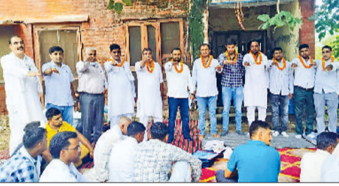
नरवाना। यूनिटन के नवनियुक्त पदाधिकारी शाय लते हुए।