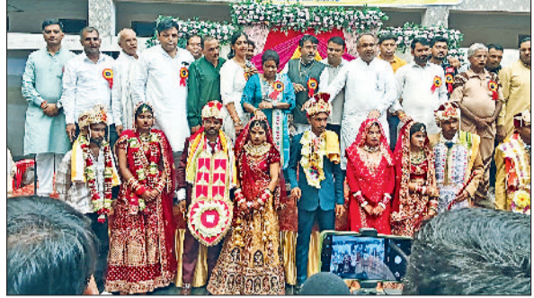
राजौद। सामूहिक विवाह के दौरान संस्था के सदस्य।

और भविष्य में भी उनका प्रयास है। देकर आयोजन को सफल बनाने में