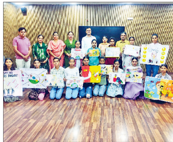
कैथल। प्रतियोगिता में अबल रही छात्राओं को सम्मानित करते पदाधिकारी।

श्री कपिल मुनि राजकीय महिला महाविद्यालय कलायत (कैथल) में उच्चतर शिक्षा विभाग के दिशा निर्देशानुसार डूंग अवेयरनेस कार्यक्रम का आयोजन किया गया। उच्चतर शिक्षा विभाग के द्वारा अगस्त माह में स्लोगन व पोस्टर प्रतियोगिता आयोजन करने का निर्देश दिया गया था, उसी का अनुपालन करते हुए महाविद्यालय में स्लोगन व पोस्टर प्रतियोगिता का आयोजन किया गया। इस अवसर पर छात्राओं ने नशीले पदार्थों के सेवन के दुष्प्रभाव को अपने स्लोगन और पोस्टर के माध्यम से दर्शाया व उन्होंने महाविद्यालय की अनेक छात्राओं को भी नशीले पदार्थों के सेवन से होने वाले नुकसान के प्रति