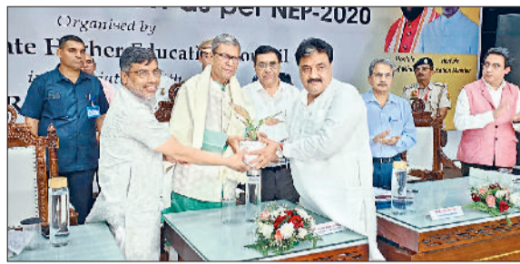
जीद। महामहिम राज्यपाल को पौधा भेंट करते हुए शिक्षा मंत्री व डिप्टी स्पीकर।