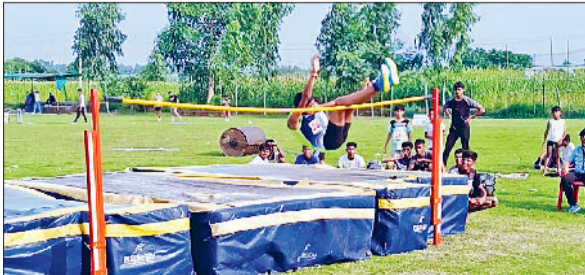
जीद। प्रतियोगिता में दमखम दिखाते खिलाड़ी।

विद्या भारती अखिल भारतीय शिक्षा संस्थान द्वारा आयोजित प्रांतीय खेलकूद प्रतियोगिता के दूसरे दिन खिलाड़ियों ने एथलेटिक्स की विभिन्न स्पर्धाओं में शानदार प्रदर्शन किया। प्रतियोगिता स्थल पर सुबह से ही खिलाड़ियों में उत्साह और जोश देखने को मिला। प्रतियोगिता में 100, 200, 400, 600 और 1500 मीटर दौड़, साथ ही हाई जंप, लॉग जंप, डिस्कस थ्रो, शॉट पुट, जैवलिन थ्रो, गोला फेंक और हेमर थ्रो की प्रतियोगिताएं संपन्न हुईं। 400 मीटर दौड़ में कुरुक्षेत्र ने बाजी मारी