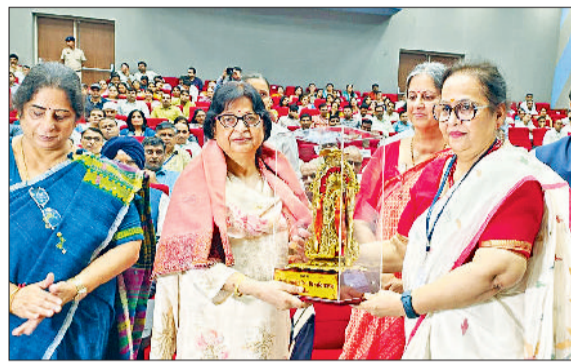
जीद। महामहिम राज्यपाल की पत्नी को स्मृति चिन्ह देते हुए।

से विकसित हो रहे वैश्विक परिदृश्य में, जहां विज्ञान और मानविकी, प्रौद्योगिकी और कला, अनुसंधान और उद्यमिता के बीच की सीमाएं लगातार कमजोर होती जा रही हैं, यह आवश्यक है कि हमारी शिक्षा प्रणाली समग्र विचारकों, नवप्रवर्तकों और समस्यासमाधान कर्ताओं का पोषण करेगी। विषयों का यह समिश्रण रचनात्मकता को प्रेरित करेगा। आलोचनात्मक सोच को बढ़ावा देगा और हमारे छात्रों को अनिश्चित दुनिया में सफल होने के लिए आवश्यक अनुकूलन शीलता विकसित करने में सक्षम बनाएगा।