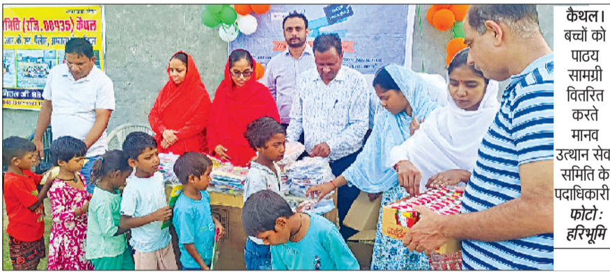
कैथल। बच्चों को पाठ्य सामग्री वितरित करते मानव उद्यान सेवा समिति के पदाधिकारी।

कार्यकर्ताओं को जोड़ने तथा सेवा भाव को पार्टी की पहचान बनाने पर जोर दिया। संक्षिप्त विश्राम के बाद 12:15 से 1 बजे तक ‘प्रदेश सरकार की योजनाओं’ पर