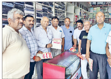
उचाना। युवक व युवती परिचय सम्मेलन को लेकर निमंत्रण पत्र देते हुए।