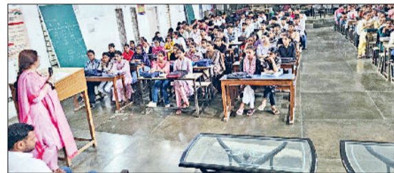
नरवाना। कार्यक्रम में उपस्थित विद्यार्थियों को जानकारी देते हुए वक्ता।