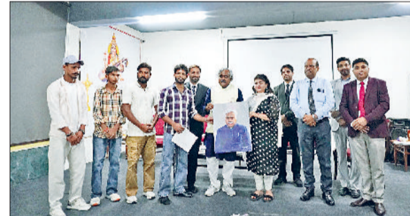
जीद। कार्यक्रम में मौजूद अतिथि।