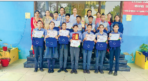
जीद। सीनियर वर्ग में पहला स्थान पाने वाली डीएन स्कूल की टीम।